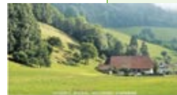
Eine kulinarische Entdeckungsreise DURCH DEN SCHWARZWALD

Gewinnen Sie den wertvollen Bildband „Eine kulinarische Entdeckungsreise durch den Schwarzwald!“ Senden Sie bis Dienstag, 7. August um 20 Uhr, eine E-Mail mit „Entdeckungsreise“ im Betreff, Ihrem Namen und ggf. Ihrer Telefonnummer an redaktion@NRWZ.de Die NRWZ verlost drei Exemplare. Zur Teilnahme sind ausschließlich E-Mails zugelassen. Der Rechtsweg ist ausgeschlossen. Mitarbeiter des NRWZ Verlages dürfen leider nicht teilnehmen.